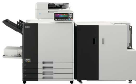
ORメーリングフィニッシャー II