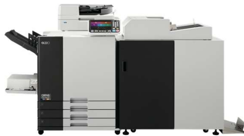
ORくるみ製本フィニッシャー II